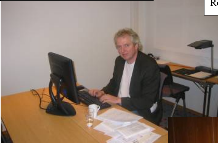
Ensom journalist i presserommet